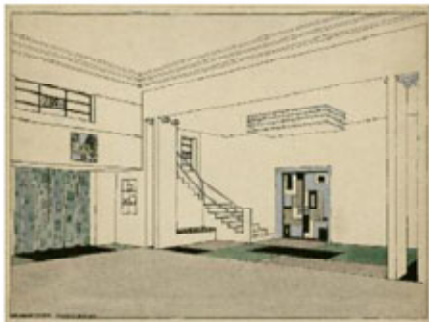
Hall d'une ambassade française, réalisation et projet.

126 - MOODY BOUTY STUDIO - L'AMBIANCE ARCHITECTURALE DES VILLES