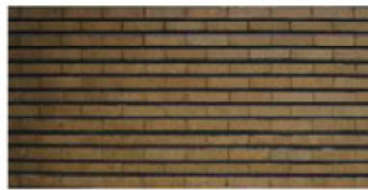
Balconio d'accesso al giardino depuis la salle à manger des enfants (1904). Appareillage de briques.