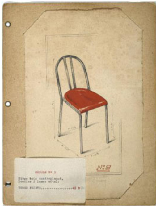
DESIGN DE LA CHAISE MOODY N°3.

127 - MOODY BOUTY STUDIO - MOODY STONES ET L'EAU