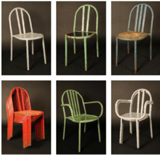
Charles Tubert, avec deux de ses frères, avec et sans accoudoirs, fauteuils de jardin.

124 - MOODY BOUTY STUDIO - MOODY STONES ET L'EAU