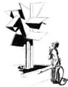
L'annonce per glorio davanti l'arbre cubista, dentro park dans l'urbanisation.

126 - MOODY BOUTY STUDIO - L'AMBIANCE ARCHITECTURALE DES VILLES