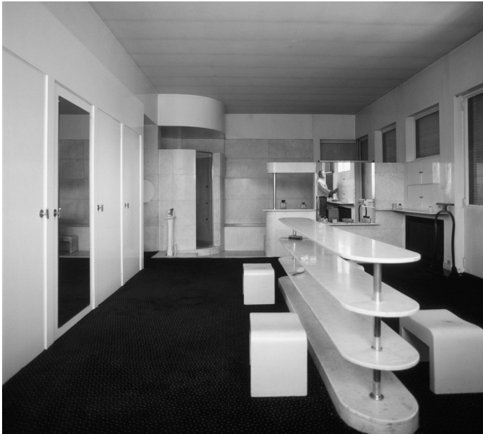
De badkamer, foto Vera Cardot en Pierre Joly, 1986, fonds Cardot-Joly, Bibliothèque Kandinsky, Centre Pompidou, Paris.